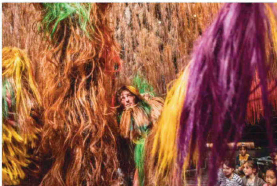
« À poils » d'Alice Laloy © Jean-Louis Fernandez