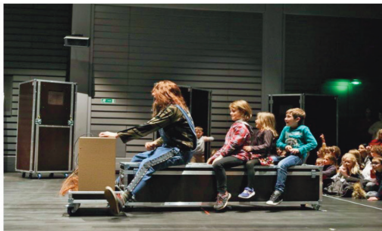
À poils, la nouvelle création d'Alice Laloy. Une coproduction de la Comédie de Colmar et de la Compagnie S'appelle Reviens.

L ors de la première répétition publique d' À poils mercredi dernier, les enfants ont été priés de sortir de la Comédie de Colmar afin de rentrer directement dans la grande salle. Cette dernière n'a jamais été aussi grande. Toute nue, celle-ci n'offre ni décor ni strapontins. Seule trône au cœur de la pièce, une énorme flycase (coffres mobiles qu'emploient les musiciens en tournée).